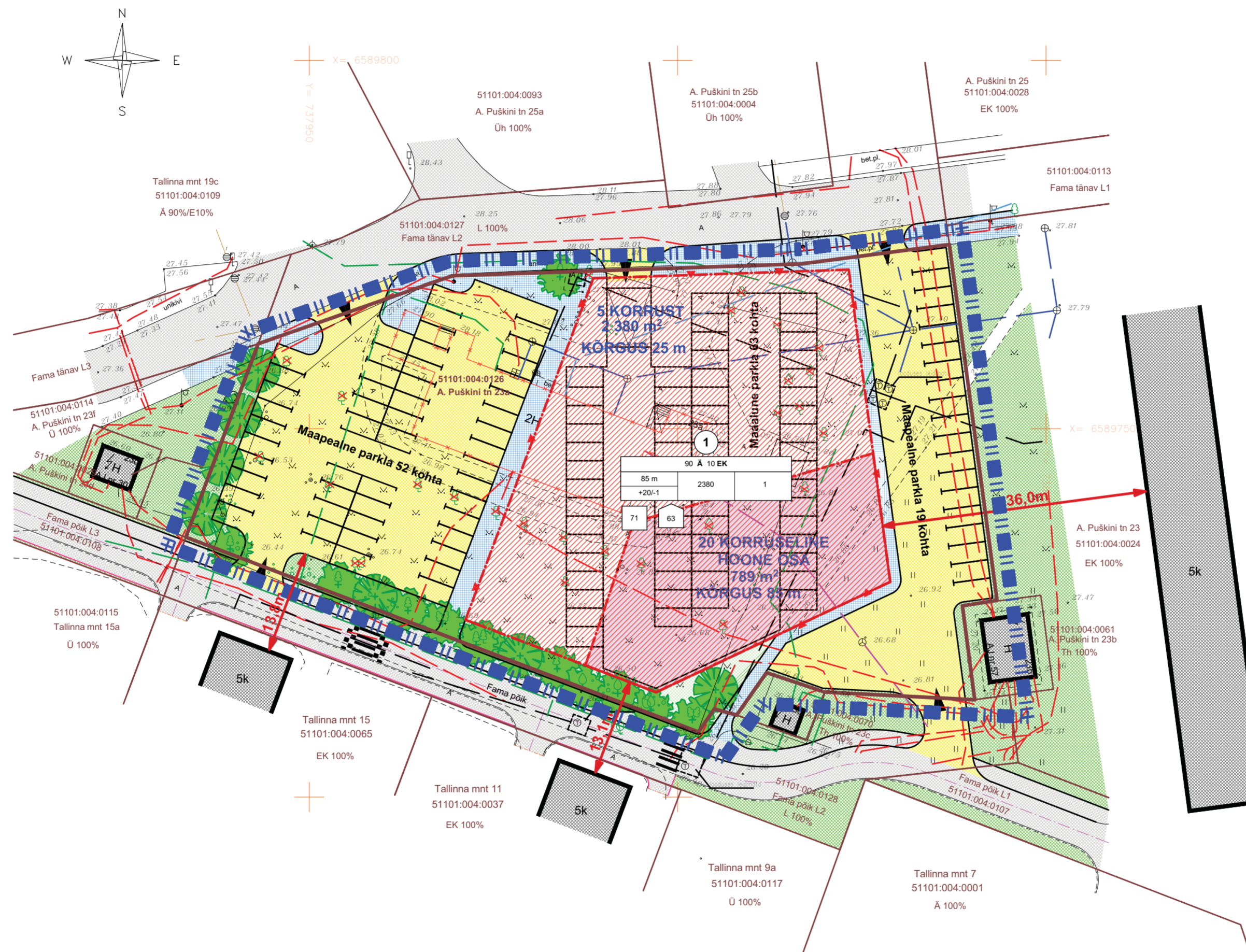
TINGMÄRGID tabel nr 1